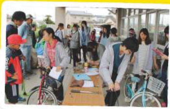
地域と大学生をマッチング