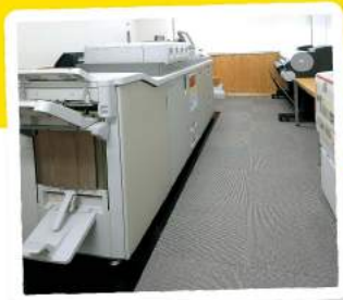
印刷機や大判プリンター