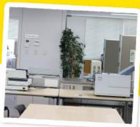
紙折機や丁合機など