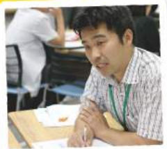
助成金申請をお手伝い