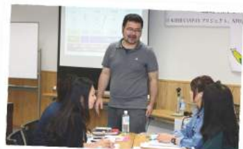
活動に役立つ各種講座を開催