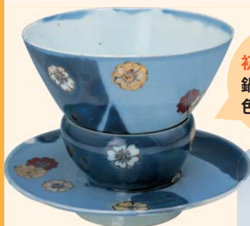
色絵茶碗(瑠璃地桜花散らし文)台共