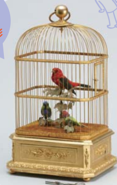
雌雄小禽入金色鳥籠