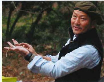
(社)KIDS GO WILD 代表

場所 佐賀県立博物館屋外スペース ※雨天時は佐賀県庁地下1階 SAGACHIKA