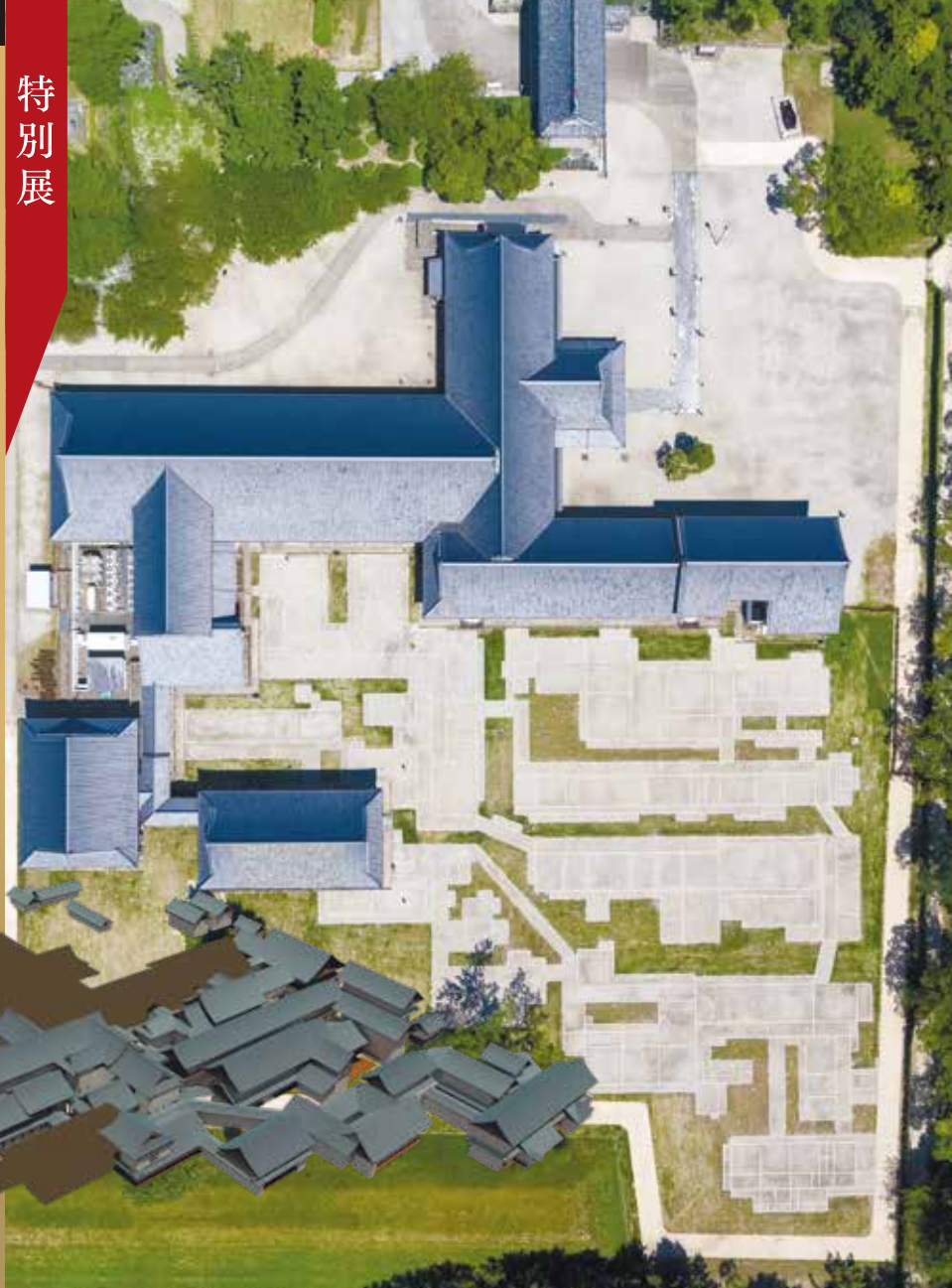
佐賀城本丸御殿完成イメージCG

5000m 2 の平面表示で御殿の規模をリアルに体感 ドローン映像とCGで本丸を全方位から眺望