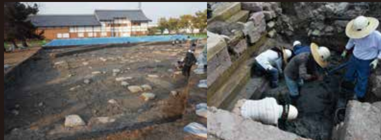
佐賀城本丸跡発掘調査風景

全国のお城ファンが注目している佐賀城本丸御殿の整備。 ついに巨大な御殿の全貌がよみがえります! 新しい佐賀城の魅力をみんなで体感しましょう!