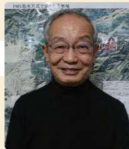
医療NGO ベシヤワール会