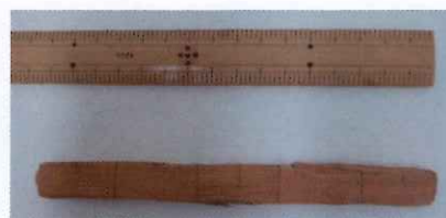
田井原条里遺跡出土標尺