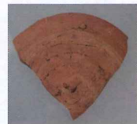
脇岬遺跡出土「高」墨書