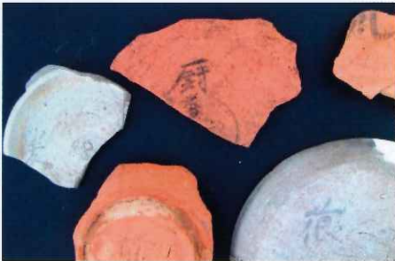
蔵上遺跡出土墨書土器

・養父郡衙と想定される蔵上遺跡から出土した「厨番」と書かれた墨書土器や鉄製品を作成した工房と思われる竪穴住居跡から出土したフィゴの羽口等の展示を行います。