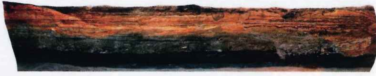
関屋土塁 版築条遺構

・古代山城である基肄城出土遺物や、南側の外郭線にとされる関屋土塁、奈良時代に施工された可能性のある道路状遺構を検出した古寺遺跡などの調査成果を紹介します。