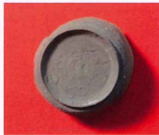
八藤遺跡出土「薬」刻書