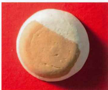
船石遺跡出土「肥人」刻書

・郡司層の氏寺と想定されている塔の塚廃寺から出土した軒丸瓦や、船石遺跡出土の「肥人」、八藤遺跡出土の「薬」の刻書土器を展示します。