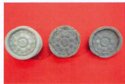
塔の塚廃寺跡出土軒丸瓦