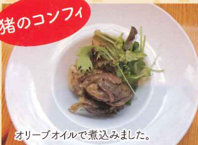
オリーブオイルで煮込みました。