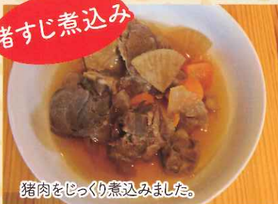
猪肉をじっくり煮込みました。