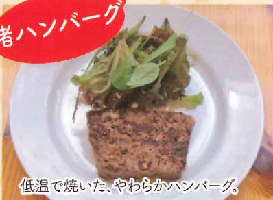
低温で焼いた、やわらかハンバーグ。