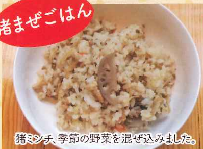
猪ミンチ、季節の野菜を混ぜ込みました。