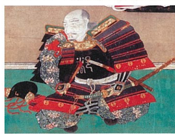
藩祖鍋島直茂像(高傳寺蔵)