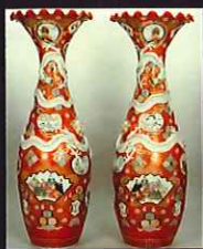
色繪六取仙白磁文大花瓶 1894(明治27)年 / 佐賀県立美術館蔵