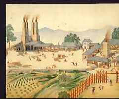
「築地反射炉図」