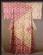
鈴田滄人 木箱裡夏紗着物「露景文」 1999(平成11)年 / 佐賀県立美術館蔵