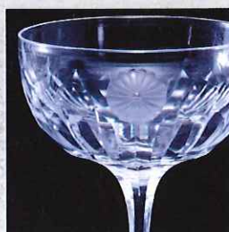
菊御紋玻璃コップ 明治25年(1892) 永田町の鍋島邸西洋館落成を記念し行幸された明治天皇より直接手渡しで拝領したシャンパングラス。