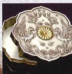
ボンボニエール 明治時代～昭和時代 皇族や華族では、成人式や結婚式といった御慶事の宴席出席者に、金平糖などを入れたボンボニエールという小箱を引出物として添えた。