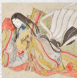
女房三十六人歌合 江戸時代前期 鍋島邸にふさわしいとして御歌所より栄子夫人に贈られた和歌短冊帖。侯爵鍋島家は御一家で和歌を唄んだ。