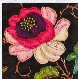
西洋刺繍 明治時代前期(1870年代後半) 鍋島直大と共にイギリスに渡った胤子夫人が手習いとして制作した稀少な作例。随行の百武兼行は夫人の御相手役としてこのとき洋画を始めた。