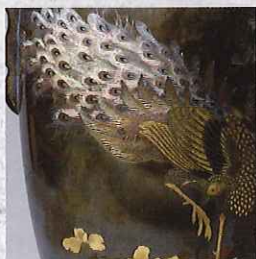
菊御紋付牡丹孔雀象嵌銀製花瓶 明治25年(1892) 象嵌の技法による牡丹と孔雀が華やか。鍋島邸西洋館落成を記念し行幸された明治天皇より拝領。