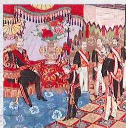
立皇太子御式台切丸伝進之図 明治22年(1889) 宮内省式部長官として明治天皇の御側に長年仕えた鍋島直大は、天皇の代参など数々の宮中儀礼を勤めた。