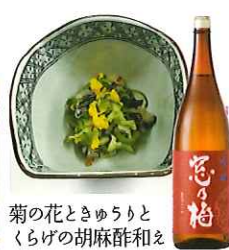
菊の花ときゅうりと くらげの胡麻酢和え

☎58-2211 佐賀市富士町古湯865 IN/15:00 OUT/10:00 休/なし