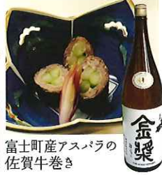
富士町産アスパラの 佐賀牛巻き

☎58-2216 佐賀市富士町小副川12635 IN/15:30 OUT/10:00 休/不定休