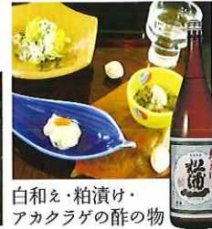
白和え・粕漬け・ アカラゲの酢の物

☎51-8111 佐賀市富士町古湯556 IN/15:00 OUT/11:00 休/不定休