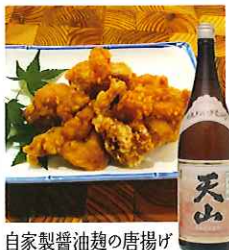
自家製醤油麹の唐揚げ

☎58-2047 佐賀市富士町古湯878 IN/15:00 OUT/10:00 休/不定休