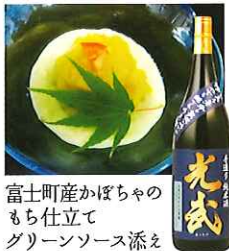
富士町産かぼちゃの もち仕立て グリーンソース添え

☎58-2120 佐賀市富士町小副川2208-1 IN/15:00 OUT/10:00 休/なし