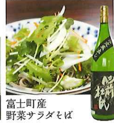
富士町産 野菜サラダそば

☎58-2005 佐賀市富士町古湯836 IN/15:30 OUT/10:00 休/なし