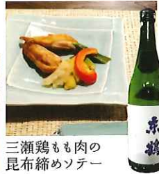
三瀬鶏もも肉の 昆布締めソテー

☎58-2131 佐賀市富士町古湯877-1 IN/15:00 OUT/10:00 休/毎週水曜日