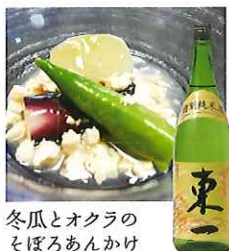
冬瓜とオクラの もぼろあんかけ

☎58-2106 佐賀市富士町古湯792-1 IN/15:00 OUT/10:00 休/不定休