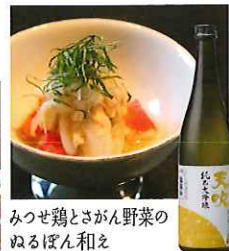
みつせ鶏とさがん野菜の ぬるぼん和え

☎58-2101 佐賀市富士町古湯860 IN/15:00 OUT/10:00 休/不定休