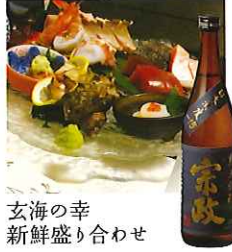
玄海の幸 新鮮盛り合わせ

☎58-2231 佐賀市富士町小副川2093 IN/15:00 OUT/10:30 休/なし