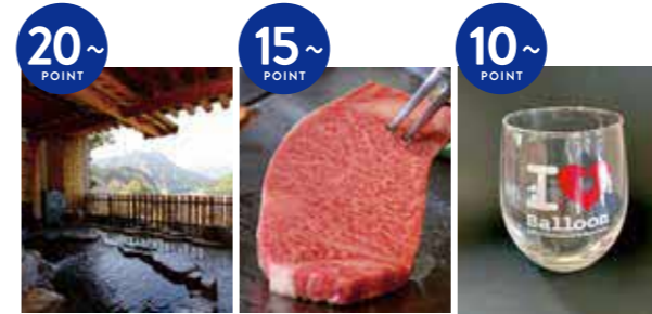
古湯・熊の川温泉ペア宿泊券【抽選で1組様】 佐賀牛ペアランチ券【抽選で2組様】 バルーングラス【抽選で20名様】