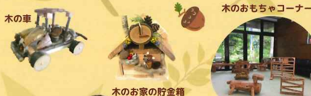
木のお家の貯金箱

森林学習展示館では、 森のクラフト体験や 木のおもちゃコーナー、 森林や林業に関する 展示を常設しています。