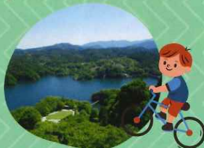
ダム湖一周レンタルサイクル