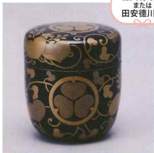
徳川将軍家 または 田安徳川家

黒漆塗葵紋付葵唐草蒔絵甕 江戸時代後期 10代直正公の 正室・盛姫または継室・筆姫 所用