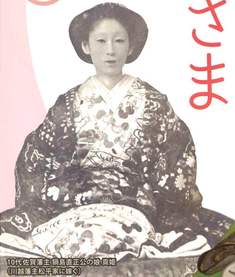
10代佐賀藩主 鍋島直正公の娘 貢姫 (川越藩主松平家に嫁ぐ)