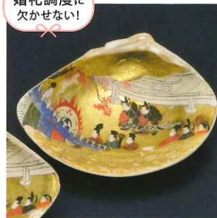
婚礼調度に 欠かせない!