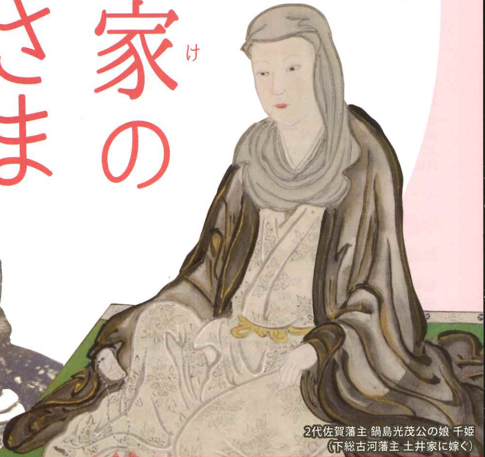
2代佐賀藩主 鍋島光茂公の娘 千姫 (下総古河藩主 土井家に嫁ぐ)