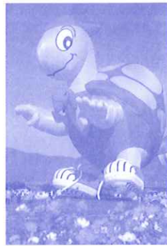
第5回入選 「佐賀バルーンフェスタ2007-5」 今津 盛一