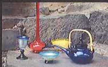
職人の心が込められた作品