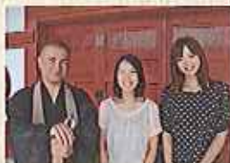
優しい出陣和尚、地元グルメも詳しいよ