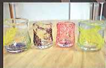
お楽しみしてほしかったです！