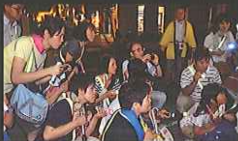
昨年3月から開始して参加者は1200人を超え、夜中電柱のふりかざり上がるのは「おおく(野)の首領」や「おかんの屋敷の川」そして恵比須さんの夜の御冥加

10/1(土)・8(土)・22(土)・29(土) 10月18:00～20:00 11/2(水)・3(祝)・12(土)・26(土) 11月17:30～19:30 (約2時間)