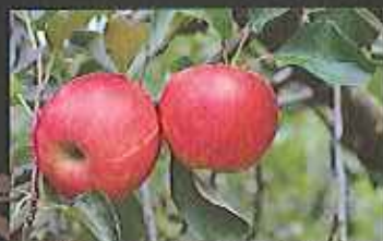
リンゴは丸ごと3つおしりまるじゅんりんご園にて