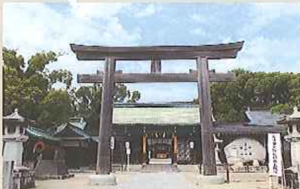
佐喜神社の鳥居。敷地内には他に六社があり、それぞれ別の神様が祀られている。「白狐の鳥居」や「熊念の駒大」なども興味深い。