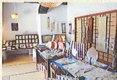
ゆったりとした気分になれるギャラリー