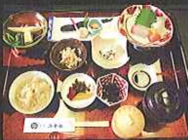
名物割烹で味わう芋粥と有明海の珍味