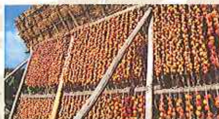
昔ながらの熟成させる柿小屋で干します