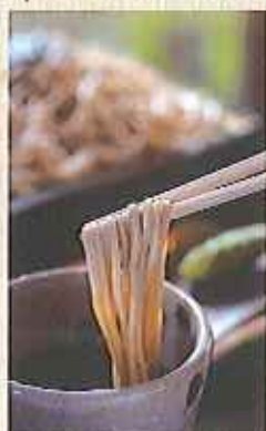
出来上がりイメージ写真

11/20(日)・27(日) 12/4(日) 10:30~13:30 (3時間)