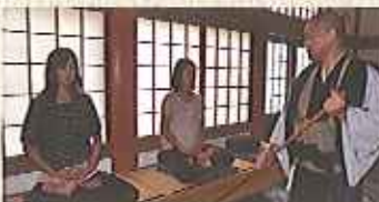
10分間のドキドキ体験。あ、和尚が近づいてきた気が...

ホテルで朝食をいただいた後、軽装で行ってらっしゃい！大興寺は駅から8分なので、駅近くのホテルだったらチェックアウト前に戻ってこれるよ