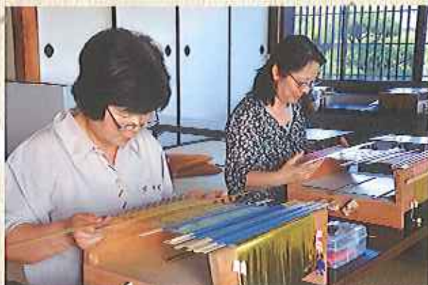
真剣な眼差しで織り進めます

10/22(土)・11/12(土)・12/10(土) 13:00~15:30 (2時間半)