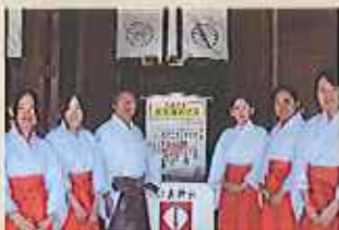
草履舞言司と巫女のみなさん。やさしい笑顔で神事参拝の楽しみが増す