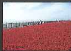
一面が赤い風景が広がる

最大6メートルの干潟を誇る有明海に生息するむつごろうの生態を間近で観察できます。またシオマネキの引っ掛け釣り体験は、子供だけではなく大人もハマってしまう面白さ。採ったシオマネキを使って郷土の珍味「カンヅケ」を作る食育体験は中々できるものではありません。海の紅葉と言われるシチメンソウも鑑賞できて有明海の魅力を満喫できるプランです。