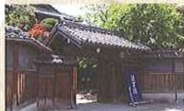
近代の和洋建築 技術の粋を集めた 旧福田家

絢爛豪華で気品のある美しさに触れ、手織り体験(1~2段程度)とオリジナルキーホルダー作りを趣きのある近代和風住宅「旧福田家」で体験してみたいかがですか?