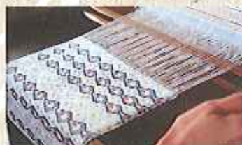
絹島産糸の雅な美しさ