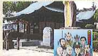
「鶴原カネ」の地・鶴神社、幕末の志士たちが一年に一度、秘密に集まった