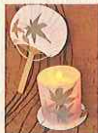
左)手のひらサイズがかわいい「おたよりうちわ」 右)灯りのゆらぎに癒される「ライトキャンドル」