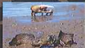
有明海にむつごろうの生態を観察できます！