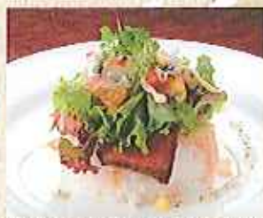
「浪漫座」シシリアンライスは、ローストビーフ(肉)使用

10/28(金) 11/11(金)・18(金)・25(金) 12/2(金)・9(金)・16(金)