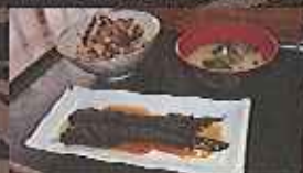
有明海の牡蠣漁師を模した海鮮丼(ランチ)

最大6メートルの干潟を誇る有明海に生息するむつごろうの生態を間近で観察できます。またシオマネキの引っ掛け釣り体験は、子供だけではなく大人もハマってしまう面白さ。採ったシオマネキを使って郷土の珍味「カンヅケ」を作る食育体験は中々できるものではありません。海の紅葉と言われるシチメンソウも鑑賞できて有明海の魅力を満喫できるプランです。