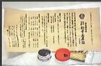
徳川家康も愛読した『方脈』の複製