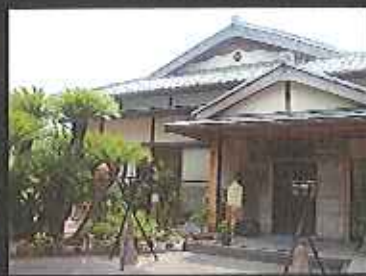
明治26年創業 割烹泉茶館の外観