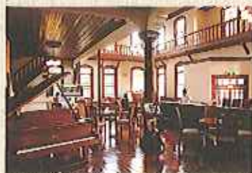
レトロな雰囲気漂うカフェ「浪漫座」

佐賀市歴史民俗館の旧古賀銀行内にあるレトロなカフェ「浪漫座」でシェフが厳選した地元の食材を使ったシシリアンライスを自分好みにトッピングして楽しめます。食材は、あらかじめカットされており、好みに応じて盛りつけるだけ。お気軽にご参加ください。浪漫座白慢の紅茶もセットで召し上がれます。