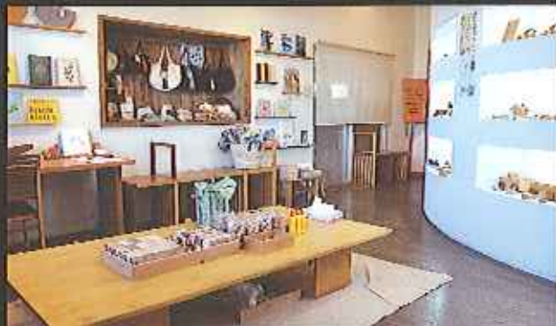
スタッフ手作りの木製の空間、ショールーム