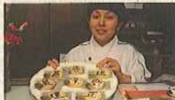
シュガーロードならではのお菓子も、和菓子も洋菓子も麻糬(写真は「伊勢巻」)