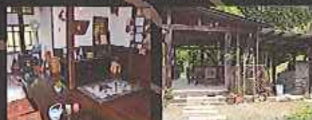
農家民宿具座の部屋が広々