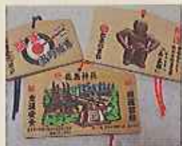
神様が遠うと絵馬も個性的。なんと河童の神様の絵馬まで!

10月~12月までの毎週日曜日 10/2(H)・9(H)・16(H)・23(日)・30(日) 11/6(日)・13(日)・20(日)・27(H) 12/4(H)・11(H)・18(H)・25(日)