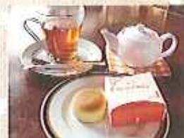
鶴屋の「肥前ケシアド」と浪漫座の紅茶をセットで