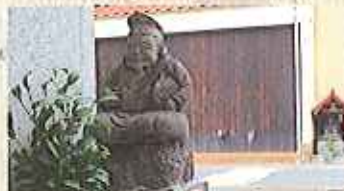
JR佐賀駅前から南下して玉環テパトまで約1キロ 200メートルをぶらぶらと、見れる恵比須さんは20体以上!