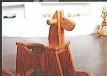
愛おむのために作った木製おもちゃ工房は始まった