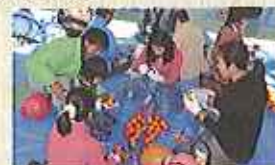
ファミリーでも楽しめる干し柿づくり