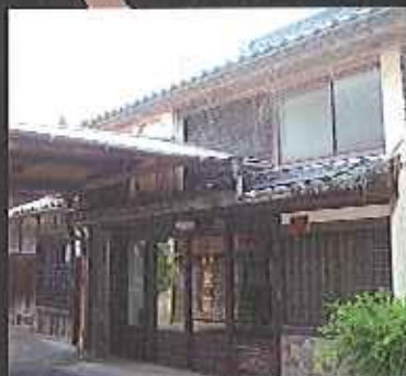
アジト「アジ」作りのかじいばあちゃんにて提供された、田中斎宮神社の玄明口

10/14(金)・21(金)・28(金) 11/4(金)・11(金)・18(金)・25(金) 12/2(金)・9(金)・16(金)