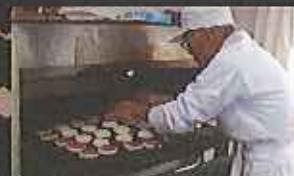
90年の伝統 赤八豆の蒸し煮