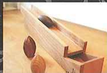
仕上げの作業を待つ子どもたち