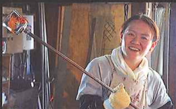
世界に一つだけのオリジナルグラスの完成

そのルーツは、幕末佐賀藩の理化学研究所「精煉方」で研究に使われていたガラス容器に始まります。高温のガラスを空中で一気に細く伸ばす「ジャッパン吹き」と呼ばれる技法は伝承者も少ない幻の技。伝統と歴史のある肥前びーどろで、世界に一つだけのオリジナルグラスを作ってみませんか？ 職人さんが親切丁寧に指導してくれるから安心して作ることができます。