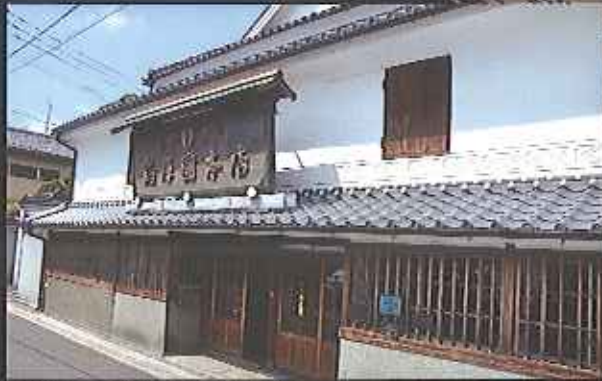
旧佐賀藩文化財の島屋(〒240年1907年)

11月2日～6日のバルーンフェスタ期間中毎日！ 11/12(土)・13(日)・19(土)・20(日) 26(土)・27(日) 12/ 3(土)・4(日)・10(土)・11(日)・17(土) 18(日)・24(土)・25(日) 10:00～12:00 (2時間)