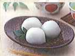
できたての「白玉饅頭」は味も格別！

佐賀を代表する伝統菓子4種類をそれぞれの老舗で満喫するツアー。「あめがた」は180年の歴史を受け継ぐ本家徳永飴、「丸ぼうろ」は昭和3年創業の村岡屋、「白玉饅頭」は130年変わらない製法を受け継ぐ元祖吉野屋で出来たてホヤホヤを。1639年創業の鶴屋が江戸時代の古文書のリシピをもとに復興した南蛮菓子「肥前ケシアド」は佐賀のレトロ街佐賀市歴史民俗館の旧古賀銀行内にある浪漫座で味わっていただきます。