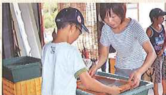
とろみのある水を前にすれば、あなたもすつかり職人気分

今回は、伝統の技を継承してきた匠に手ほどきを受けながら和紙を漉きます。模様をつけたり彩色したり、自分好みに仕上がった和紙で作るのは生活を彩る小物たち。小物制作では、「ライトキャンドル」もしくは「おたよりうちわ」のどちらかを選んでいただけます。和紙の素材の優しさに触れればあなたの心もきっと安らぐでしょう。