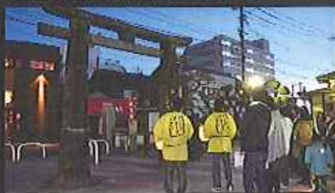
佐賀は戦国・幕末の歴史が色づく城下町。くくる歴史のひとつも、戦国武将の不思議な物語が、スペシャル版(有料)では、無人形藝者の謎はあきれておどろく

大好評の夜の散策ツアーのスペシャル版を限定2ヶ月8回開催。この秋の第四弾は★佐賀城築城400周年記念SPECIAL★として、「あの世とこの世をつなぐ」美人花魁師北原香菜子さんによる書き下ろし雑色曲の演奏にて戦国時代の武者を供養します。商店街の温かいおもてなしと、大隈重信や江藤新平らの秘密の集会所訪問や、化け猫の掛け絵写真の特別公開、商店街の探検し、「ほんとは怖い河童伝説」など人気コンテンツもさらにバージョンアップ。ご家族でカップルで、歴史や伝説が好きな方はたっぷり楽しめる2時間の散策ツアーです。解散後に使えるアフターツアーグルメクーポンでおいしいものもどうぞ！