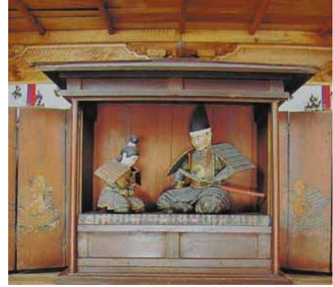
▲「義祭同盟」の象徴とも言える楠木正成と正行父子像。精神社の例祭(5月25日前後の日曜に開催)の時に開扉される