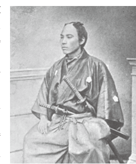
▲安政年間の副島種臣

枝吉が結成した勤王組織「義祭同盟」。しかし黒船来航で世間の情勢が一変すると、次第に勤王運動が藩の不利に繋がると思う保守派と、倒幕すら視野に入れた過激な改革派に分裂していった。そんな改革派を率いていたのが創設者の神陽自身と弟・種臣の兄弟だった。結局その活動は藩政を動かすには至らなかったが、彼らの情熱は後の維新での精神的な礎となった。