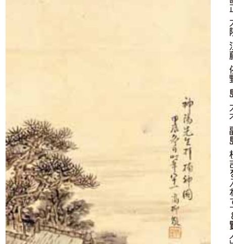
▲「神陽先生拜神図」(個人蔵/佐賀県立博物館 寄託) 枝吉の姿を伝える唯一の絵図で、楠木正成を祀っている