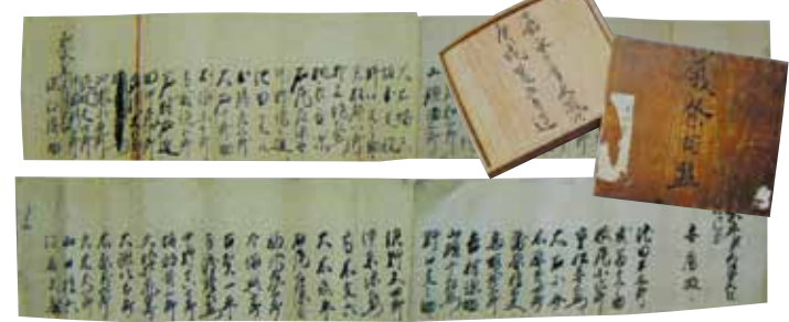
▲龍造寺八幡神社に伝わる義祭同盟の連名帳(龍造寺八幡神社蔵)