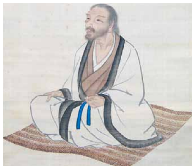
▲売茶翁像(比喜多宇隆筆/部分)(佐賀県立博物館蔵)