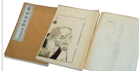
▲「売茶翁傳話」(ばいさおうげん) 売茶翁亡き後、大典顕常など当時の文化人が、その口述などをまとめた本。巻頭の肖像は伊藤若冲作(肥前通仙亭蔵)

売茶翁のその自由な精神に魅かれるのか、周りには多くの人々が集まった。江戸時代の天才画家、伊藤若冲もその一人。人物画を描かなかった若冲がただ一人描いたのが売茶翁であり、売茶翁からももらった「丹青活手の妙、神に通ず(彩色の素晴らしいは正に神業である)」の一行書を印にし、絵に捺している程心酔していた。