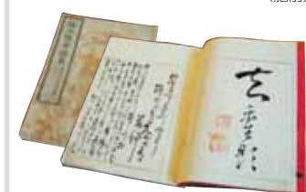
▲「梅山種茶譜略」(ばいざんしゅちゃふりやく) 売茶翁が著したお茶の歴史や作法などをまとめた本(肥前通仙亭蔵)