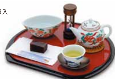
▲肥前通仙亭の「煎茶体験セット」(500円)。他に石臼で抹茶をひいて飲めるサービスもある