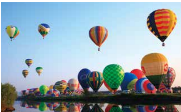
佐賀国際バルーンフェスタ 毎年秋に佐賀市嘉瀬川河川敷をメイン会場として開催される熱気球の国際的な競技大会です。参加するバルーンの数、期間中の来場者数ともにアジア最大級の規模を誇るイベントです。

大会等終了後のアフターコンベンションについてご提案いたします。コンベンションの日数や開催場所に応じて、日帰りから宿泊コースまでさまざまな楽しみ方をご用意しています。