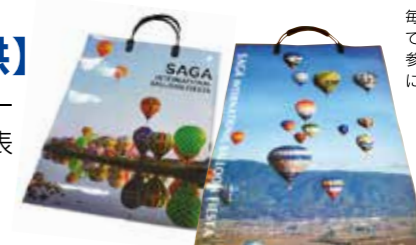
※デザインは変わることがあります

アフターコンベンションに必要な市内地図、食や観光名所などを掲載したパンフレットをご提供いたします(一部有料の場合もあります)。