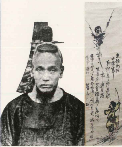
「北海道」の名付け親 松浦武四郎が描いた アイヌの人々