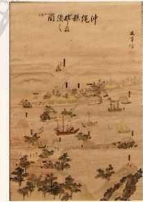
那覇港の整備に尽力

11代齋藤用之助(1859~1933)は、鍋島直彬の初代沖縄県令就任に際して沖縄に渡り、巡査として勤務した。その後、県吏に職種転換し那覇区長を9年間、島尻郡長を16年間務め、港の開削や鉄道敷設、製糖業の振興などに尽力した。なかでも、明治36(1903)年に大噴火した硫黄島から全島民を無事に久米島へ避難・移住させたことは特筆すべき業績と言える。大正4(1915)年に用之助が郡長を離任する際には、1万人余の郡民が集まり盛大な送別会が開催された。現在でも、久米島字鳥島地区では毎年2月11日の移住記念日に式典が催され“神様”のように慕われている。