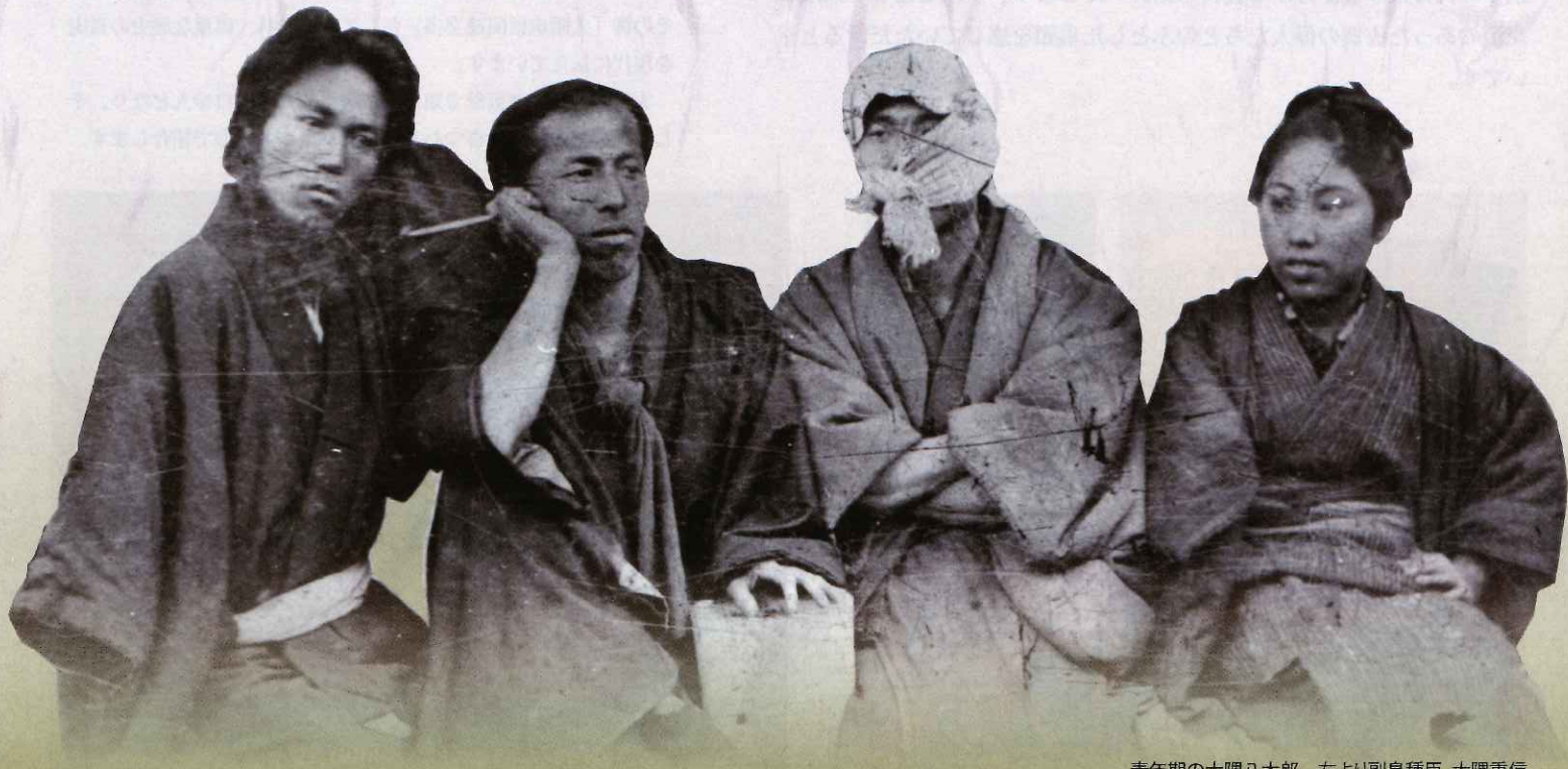
青年期の大隈八太郎 左より副島種臣、大隈重信