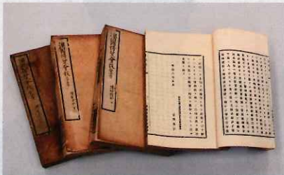
埃国博覧会報告書

本展では、大隈家に遺された手紙に焦点を当てるとともに、大隈の人物や時代背景などが分かる資料も紹介いたします。手紙を通して大隈と交流のあった佐賀の偉人たちとのふとした素顔を感じていただくと幸いです。