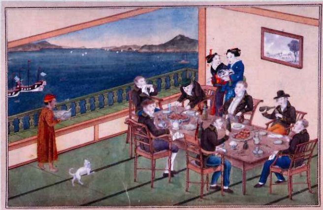
唐蘭館絵巻、蘭館図、宴会図 長崎歴史文化博物館 所蔵