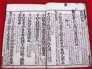
論語卷之八