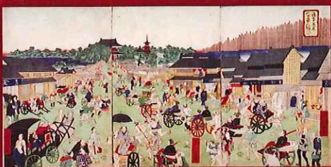
浅草並木人力車の賑ひ