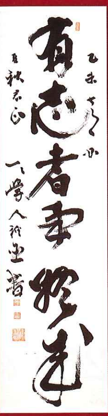
一行書「有志者事終成」[佐賀県立博物館所蔵]