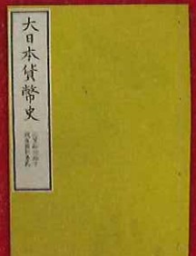
大日本貨幣史 [佐賀市大隈重信記念館所蔵]

平成30年に明治維新150年を迎えるにあ たり、様々な改革を成し得ていった大隈重信 と、佐賀の偉人たちが見ていた世界の一端 を、是非のぞいてみてください。