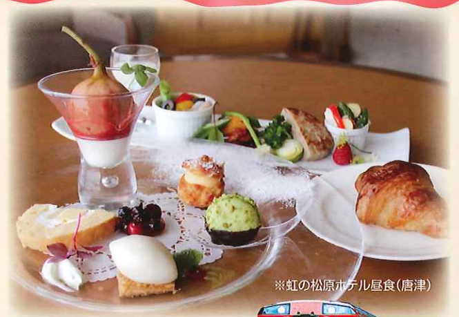
※虹の松原ホテル昼食(唐津)