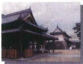
佐賀城本丸歴史館